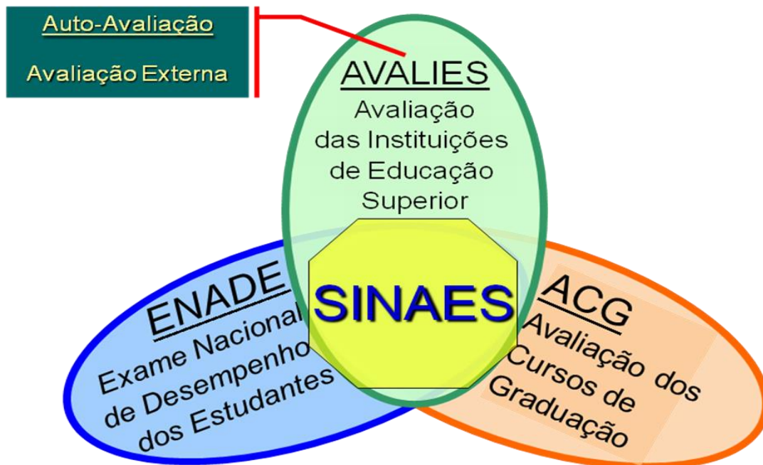
FIGURA 01 – Modelo de avaliação: