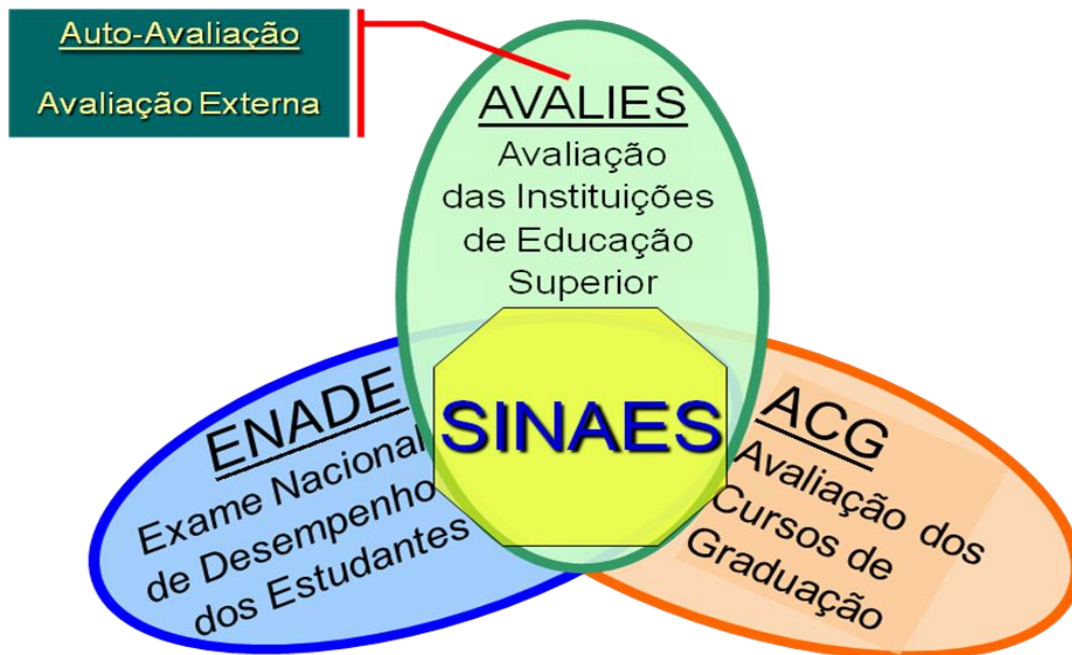
FIGURA 01 – Modelo de avaliação: